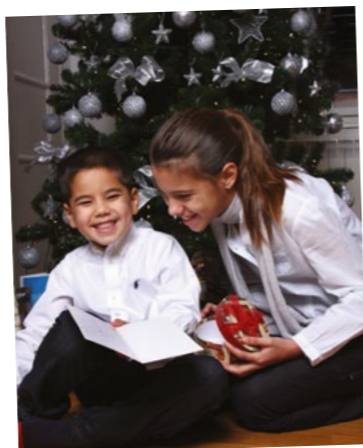
U domu Kaštela uvijek je...

• U Lombardi se i danas pale velike vatre po selu i oko njih se jedu prikle (fritule) te ispija vino iz istoga 'pota'.