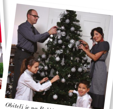
Obitelj je na Božić uvijek na okupu