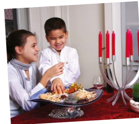
... puno smijeha, zabave i veselja