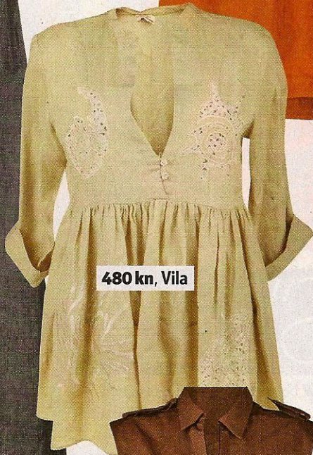
480 kn, Vila