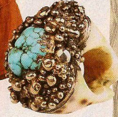
Prsten, Coral shop Irena