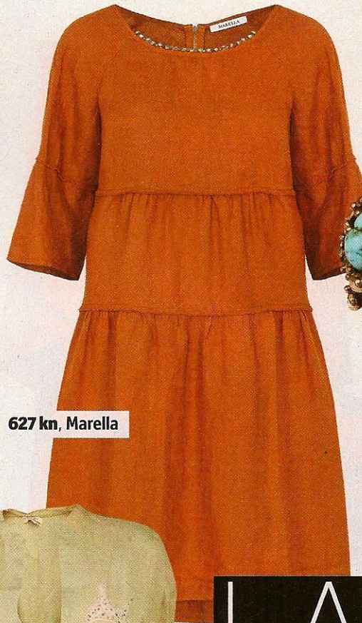
627 kn, Marella