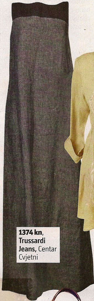
1374 kn, Trussardi Jeans, Centar Cvjetni