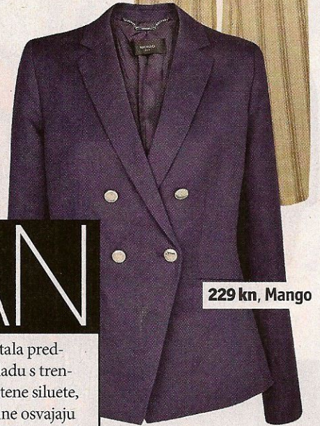
229 kn, Mango