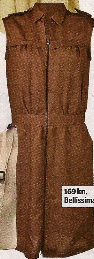
169 kn, Bellissima