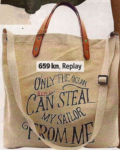
659 kn, Replay