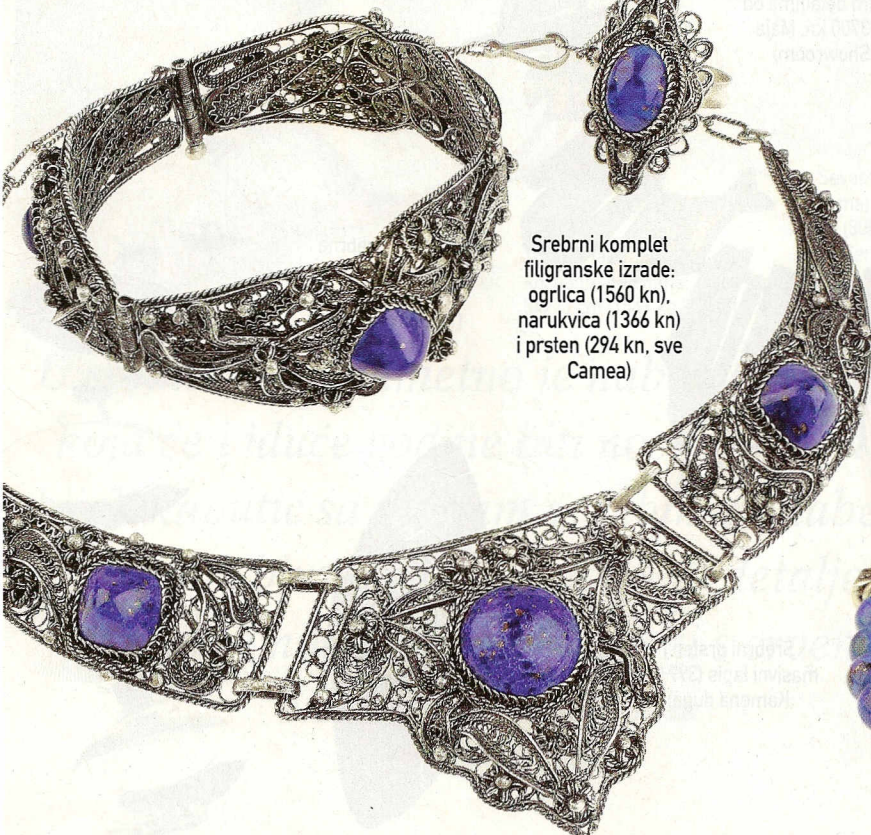
Srebrni komplet filigranske izrade: ogrlica (1560 kn), narukvica (1366 kn) i prsten (294 kn, sve Camea)

voze i napetosti te tako čuva potrebnu snagu. Zbog tog vjerovanja, lapis se najčešće nosi upravo na taj način - i to već 7000 godina.