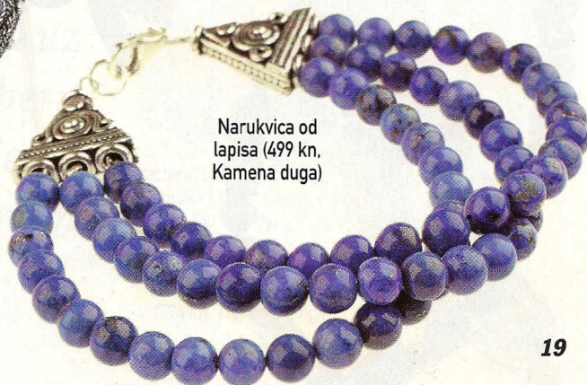
Narukvica od lapisa (499 kn, Kamena duga)