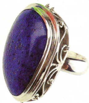
Masivni srebrni prsten (795 kn, Ornament)