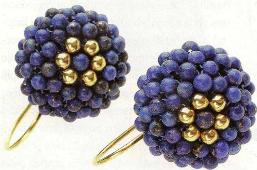
Žuto zlato i kuglice lapisa (2225 kn. Zlatarna Bashota)