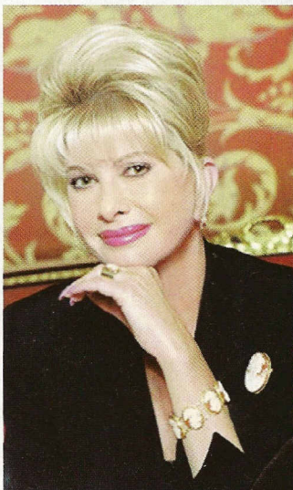
Američka poduzetnica Ivana Trump: narukvica, naušnice i prsten s kamejama