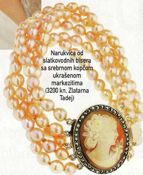
Narukvica od slatkodvodnih bisera sa srebrnom kopčom ukrašenom markezitima (3200 kn, Zlatarna Tadej)

Najekskluzivniji primjerci kameja izrađeni su od školjke s Madagaskara, no u dućanima s nakitom mogu se naći i ljupke plastične 'dame' inspirirane skupocjenim originalima