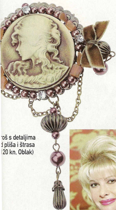
oš s detaljima i pliša i štrasa (20 kn, Oblak)