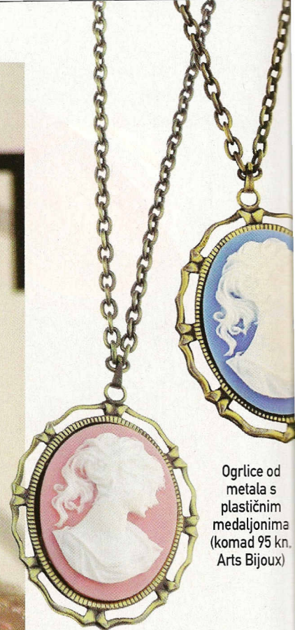
Ogrlice od metala s plastičnim medaljonima (komad 95 kn, Arts Bijoux)