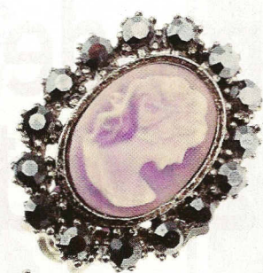
Primjerak školjke s izrezbarenom gracijom