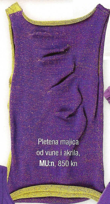
Pletena majica od vune i akrila, MU:n, 850 kn