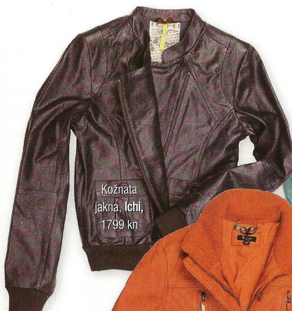
Kožnata jakna, Ichi, 1799 kn