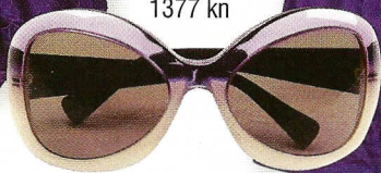
Sunčane naočale, Giorgio Armani, 1377 kn