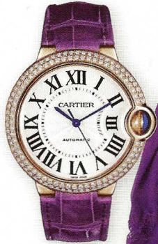
Ručni sat, Cartier, cijena na upit