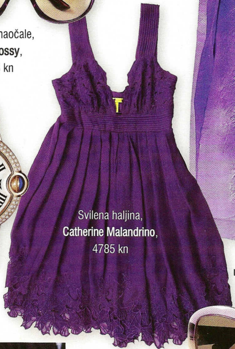
Svilena haljina, Catherine Malandrino, 4785 kn