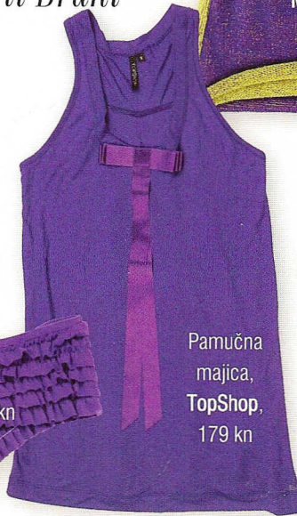
Pamučna majica, TopShop, 179 kn