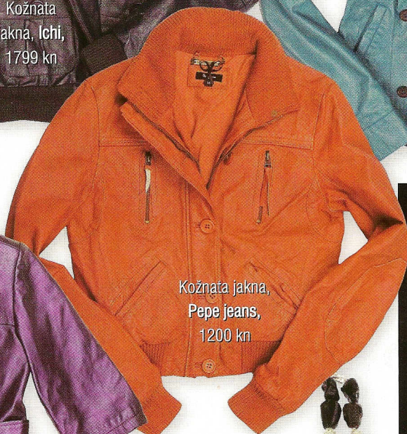
Kožnata jakna, Pepe jeans, 1200 kn