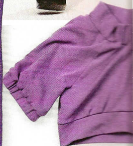
Pamučni bolero Violet, 670 kn