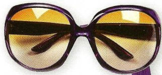
Sunčane naočale, Dior Glossy, 1293 kn