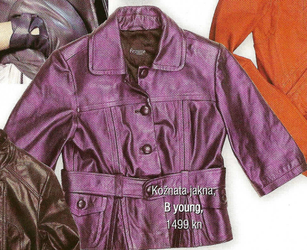
Kožnata jakna, B young, 1499 kn