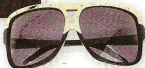
Sunčane naočale, Victoria Beckham, 1450 kn

S njima nema šale: kožnate jakne su uvijek oko nas - i u prohladnim ljetnim noćima, kad ih prebacite preko lepršave haljine, i u kišnim jesenskim danima, uz traperice i čizme