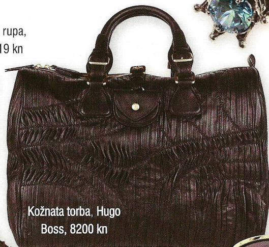
Kožnata torba, Hugo Boss, 8200 kn