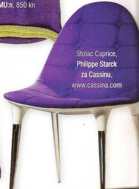
Stolac Caprice, Philippe Starck za Cassinu, www.cassina.com