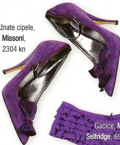
Gaćice, Miss Selfridge, 69,99 kn