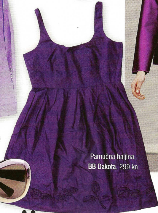
Pamučna haljina, BB Dakota, 299 kn