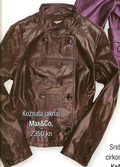
Kožnata jakna, Max&Co, 2350 kn