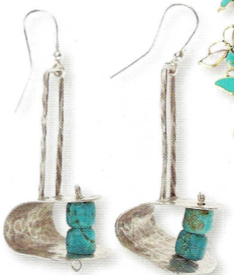
Viseće naušnice od alpake i tirkiza, Irena Kaštela, 490 kn