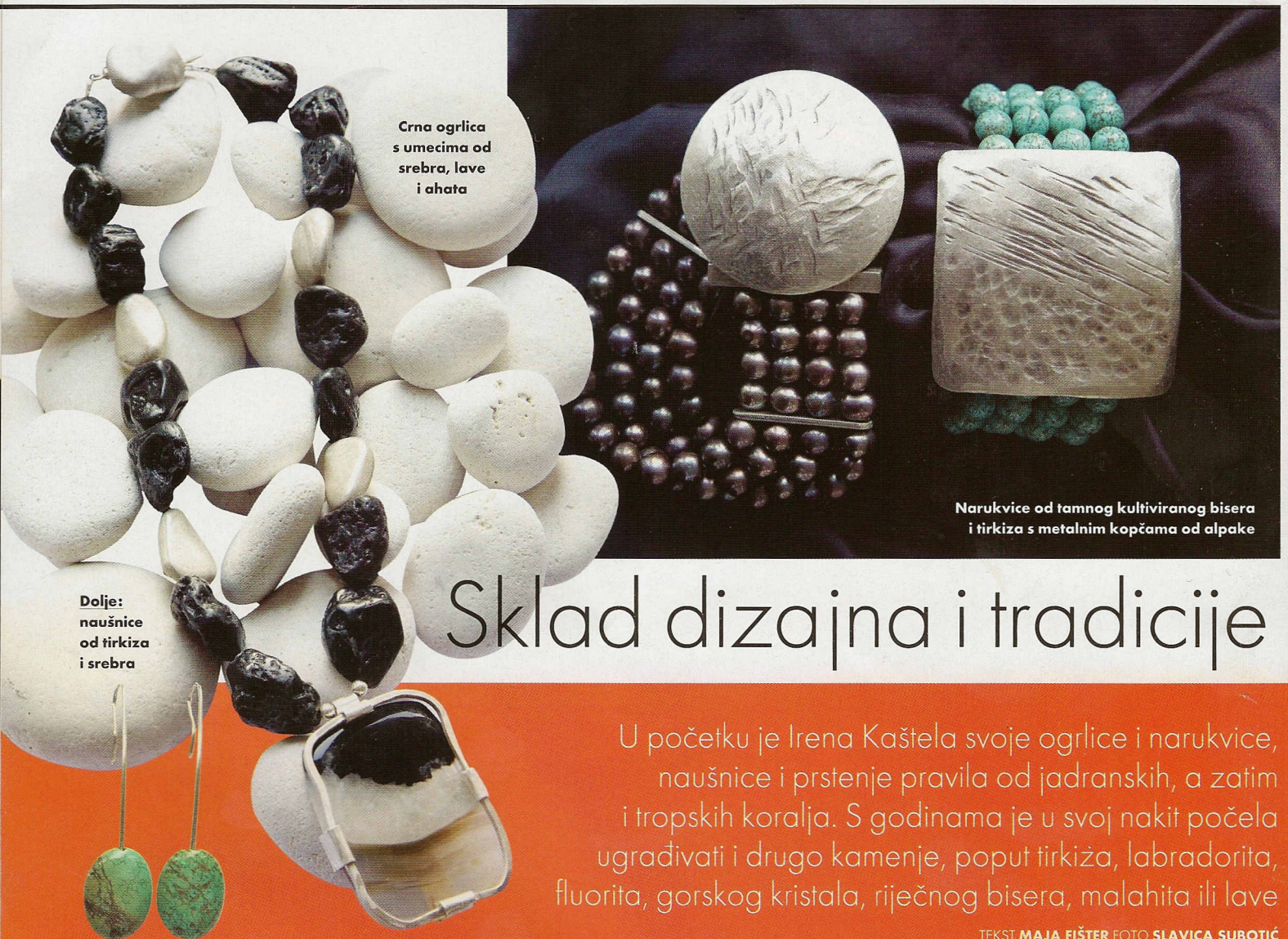
Crna ogrlica s umecima od srebra, lave i ahata