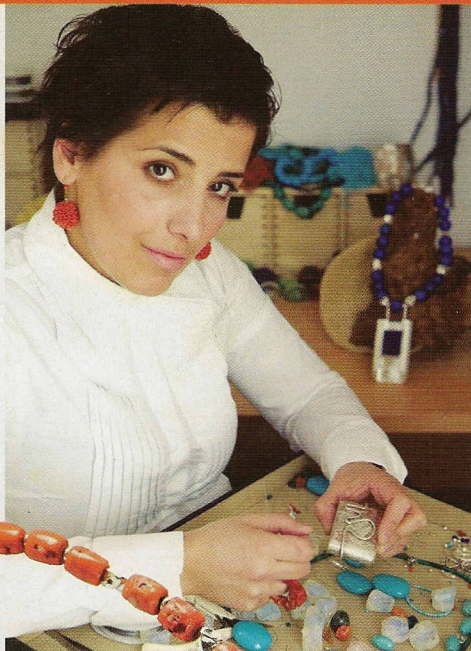
Koraljna ogrlica sa srebrom